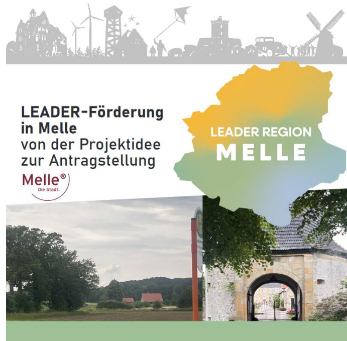
Abbildung 2: LEADER-Broschüre Melle

immer wieder auftauchen? Nach dem Vortrag zur Förderung stelle das Regionalmanagement anhand eines fiktiven Projektes den Ablauf „von der Idee bis zur Umsetzung“ einmal dar. Dieser Ablauf ist auch in die Broschüre eingeflossen, die auf der Webseite zum Download bereitsteht und in den Bürgerbüros in den Stadtteilen kostenfrei zur Verfügung steht.